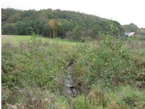
Klammersbäck vid Lödahus