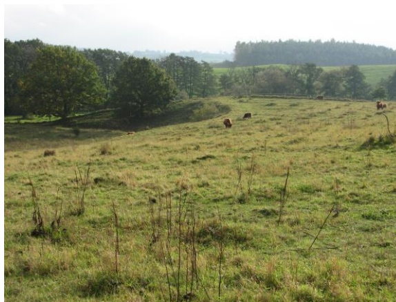
Utsikt från väg 9 söderut mot Klammersbäck