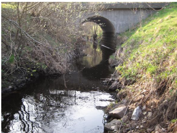
Verkaån vid Hemmeneköp