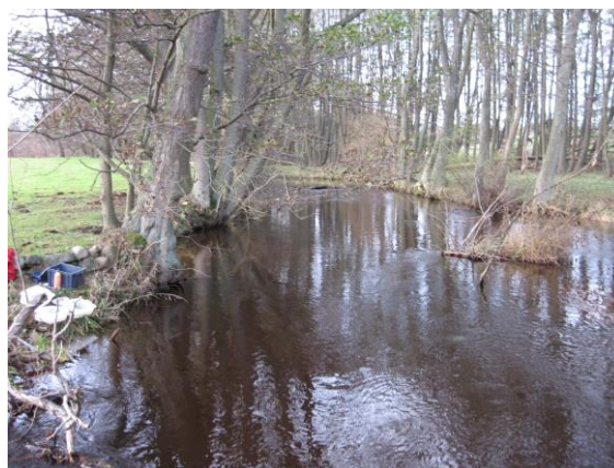
Verkaån vid Haväng