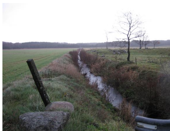
Farhultsbäcken nedströms Önnköping