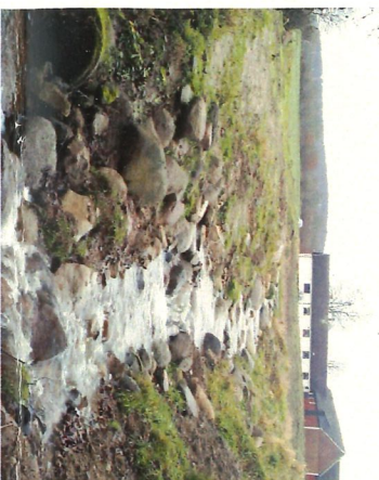
2 Kulvertens norra del vid Torupshus före och efter återskapandet av bäcken.