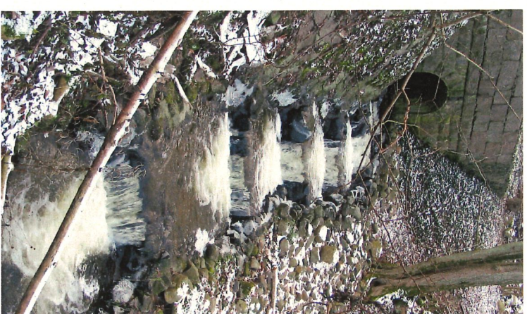
1 Den vackra järnvägsbron vid Torup med blockstenshinder har nu vandringsväg för senhöstens lekande havsöring.