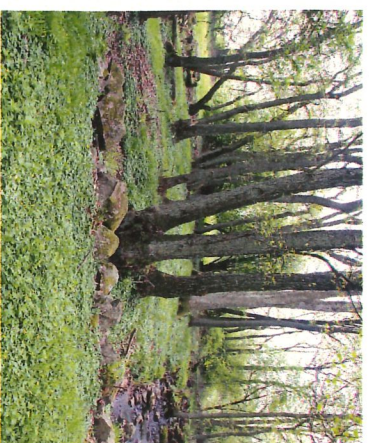
6 Den nästan bortglömda anläggningen i "Nyängen" vars enda spår är ett otydligt kvarnärke på en gammal karta.