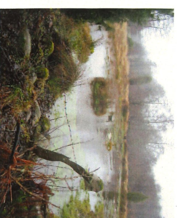
5 Den mäktiga kvarndammen vid Lilla Ljungseröd med Askeklian.