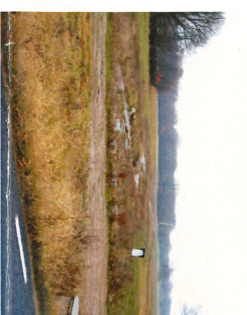
3 Åkermarken och den nya bäckfåran vid Eljarödsvägen.