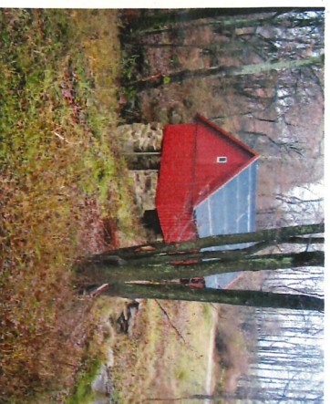
4 Strömsberg före och efter röjning med nyuppförd kvarnbyggnad.